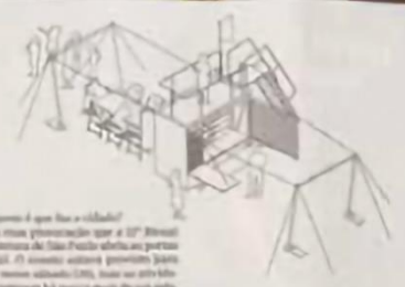
Comunidade urbana em São Paulo